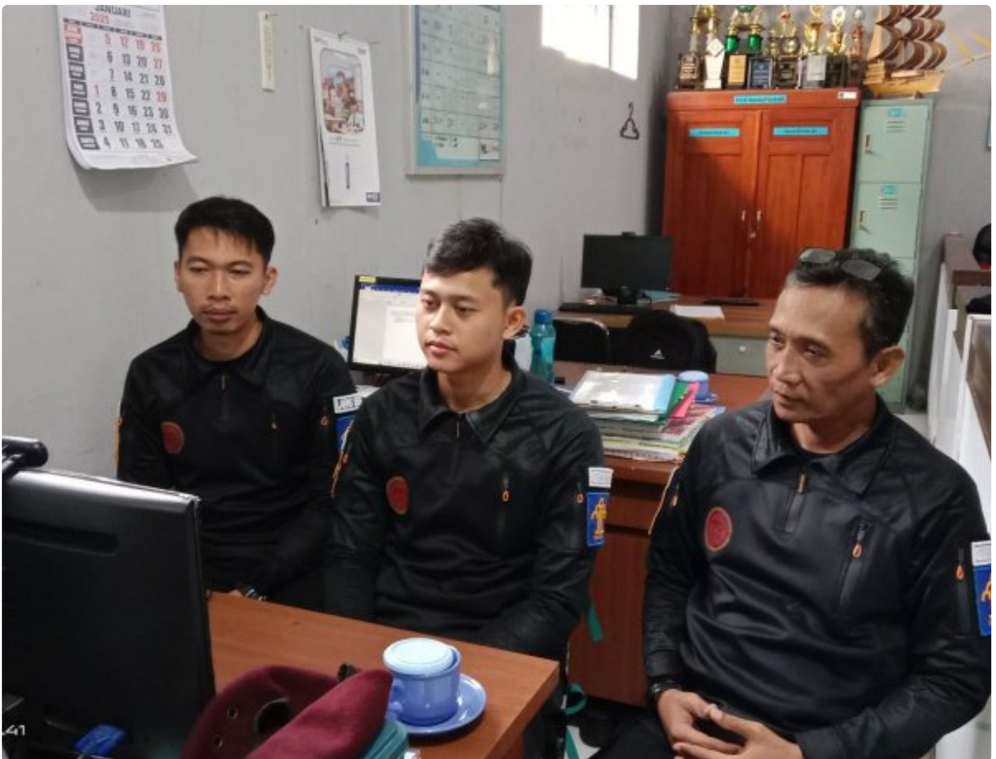
Bangun Harmoni dan Strategi, Lapas Besi Ikuti Webinar Refleksi Akhir Tahun 2024 & Resolusi 2025

CILACAP – Sebagai salah satu langkah dalam pengembangan kompetensi bagi Aparatur Sipil Negara (ASN), Petugas Lembaga Pemasyarakatan Kelas IIA Besi berpartisipasi dalam kegiatan webinar bertajuk "Refleksi Akhir Tahun 2024 dan